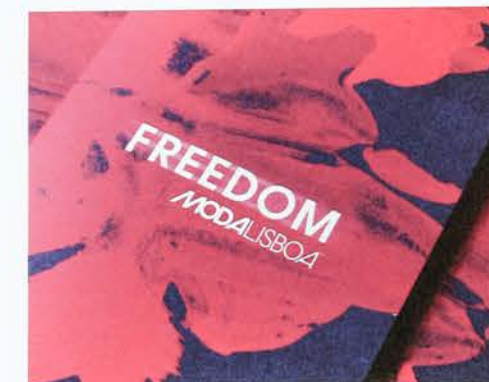
↑ 11 »Moda Lisboa Freedom«. KUNDE / CLIENT: Lisboa Fashion Week