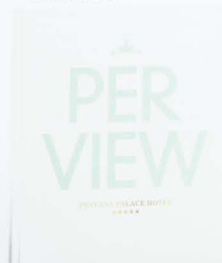
↓ 12 »PER VIEW Pestana Palace«. Gedenkbuch zum hundertsten Jahrestag der Pestana Hotels Commemorative Book for the centenary of Pestana Hotels KUNDE / CLIENT: Pestana Hotels