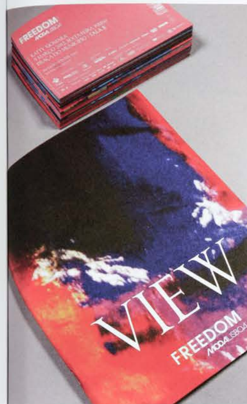
← 10 »Moda Lisboa Freedom«. Erscheinungsbild, Einladungen und Katalog, gestaltet für die Sommerausgabe der Lissabon Fashion Week mit dem Thema »Freiheit« Visual Identity, invitations and catalogue designed for the summer edition of Lisbon's fashion week under the theme: »Freedom« KUNDE / CLIENT: Lisboa Fashion Week