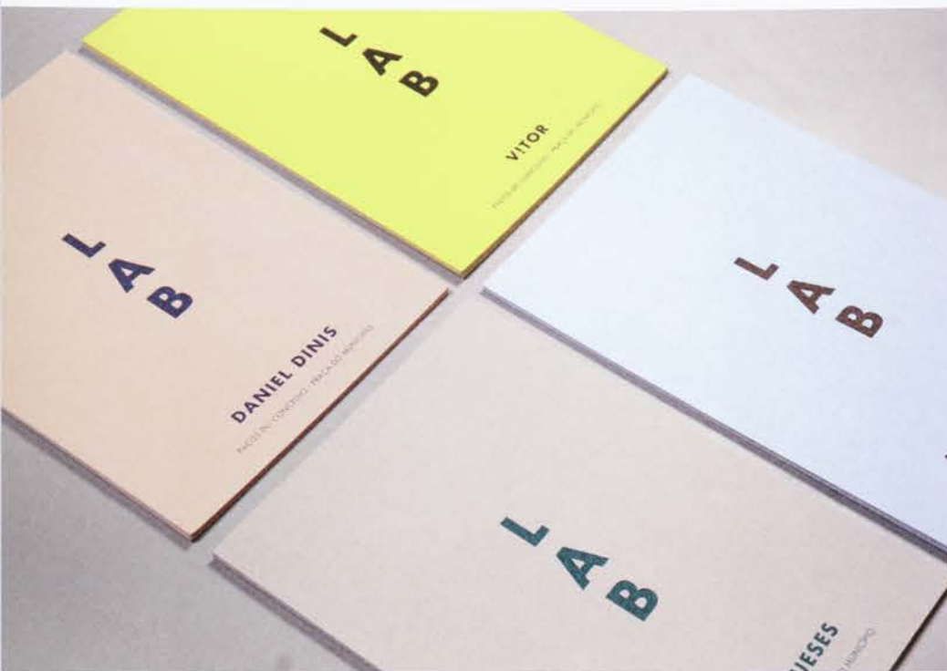
← 08 »Moda Lisboa Transfusion«. Einladungskarten Invitation cards KUNDE / CLIENT: Lisboa Fashion Week