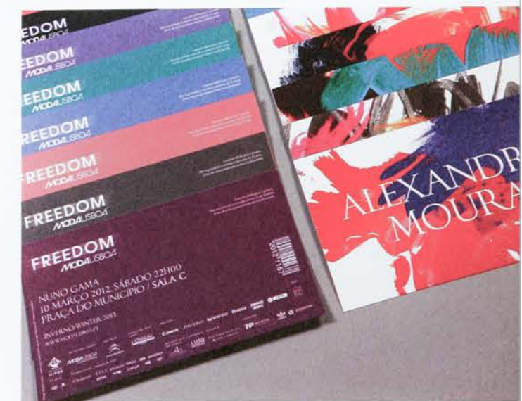
↑ 13 »Moda Lisboa Freedom«. KUNDE / CLIENT: Lisboa Fashion Week